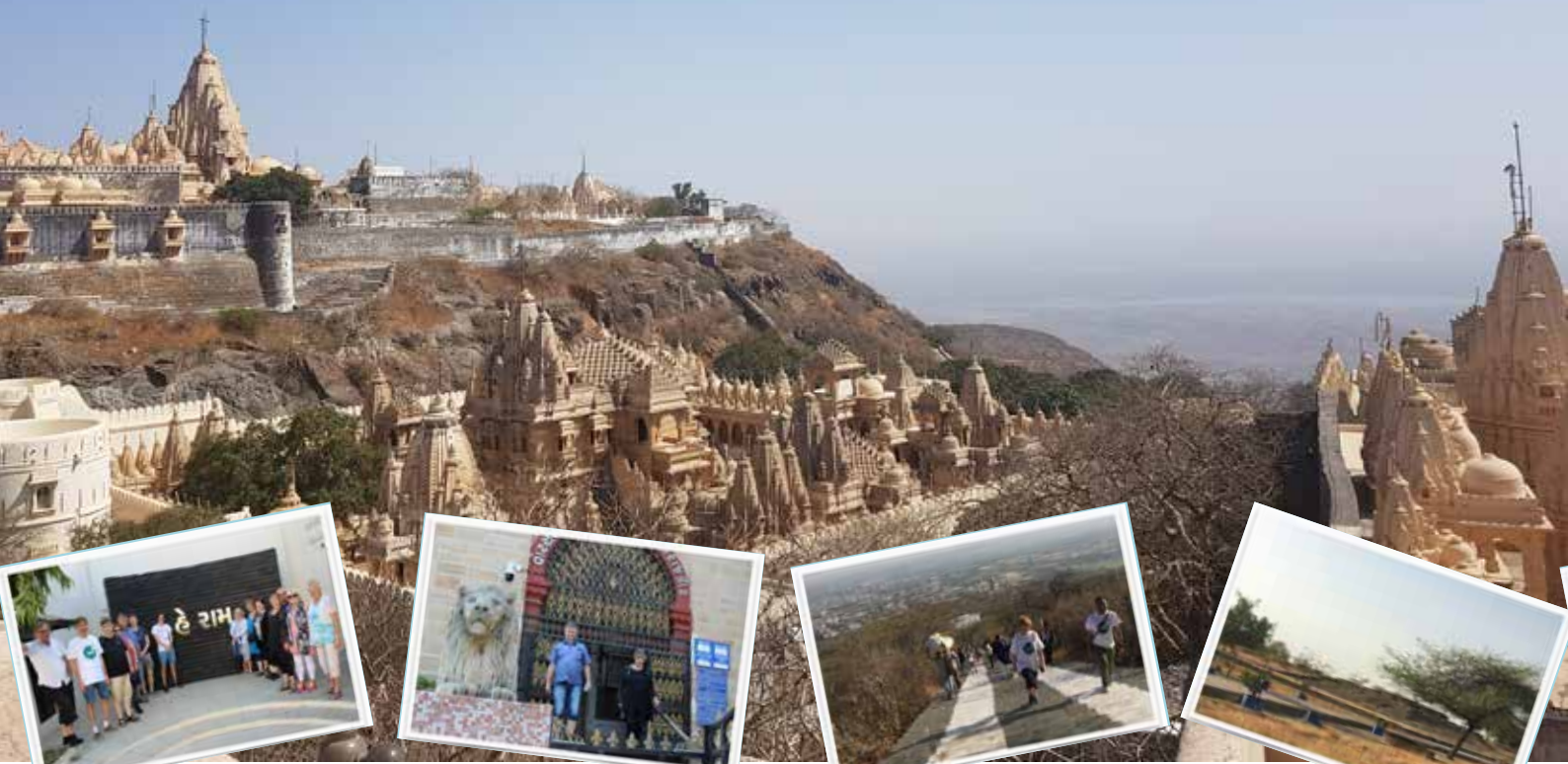
Kaba Gandhi No Dolo Gruppebilde 2019