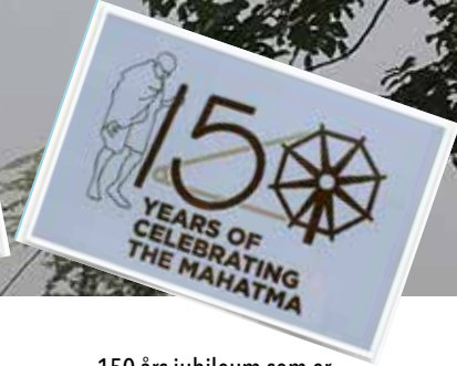
150 års jubileum som er 2. oktober 2019 for hans fødsel