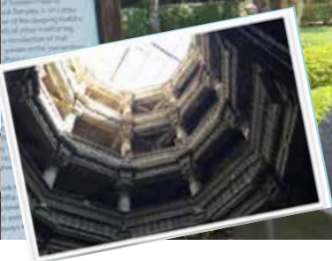
Dada Hari Vav, trappebrønn