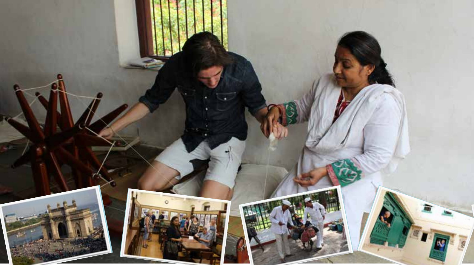
Gateway of India