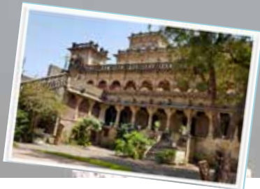
Naulakha Darbargadh Palace