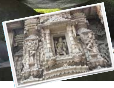
Detalj av alle utskjæringer fra Hathe Sing Jain -tempelet